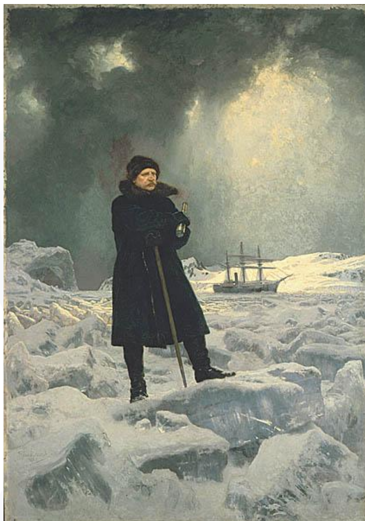
Adolf Erik Nordenskiöld ja Vega-alus Koillisväylällä 1878