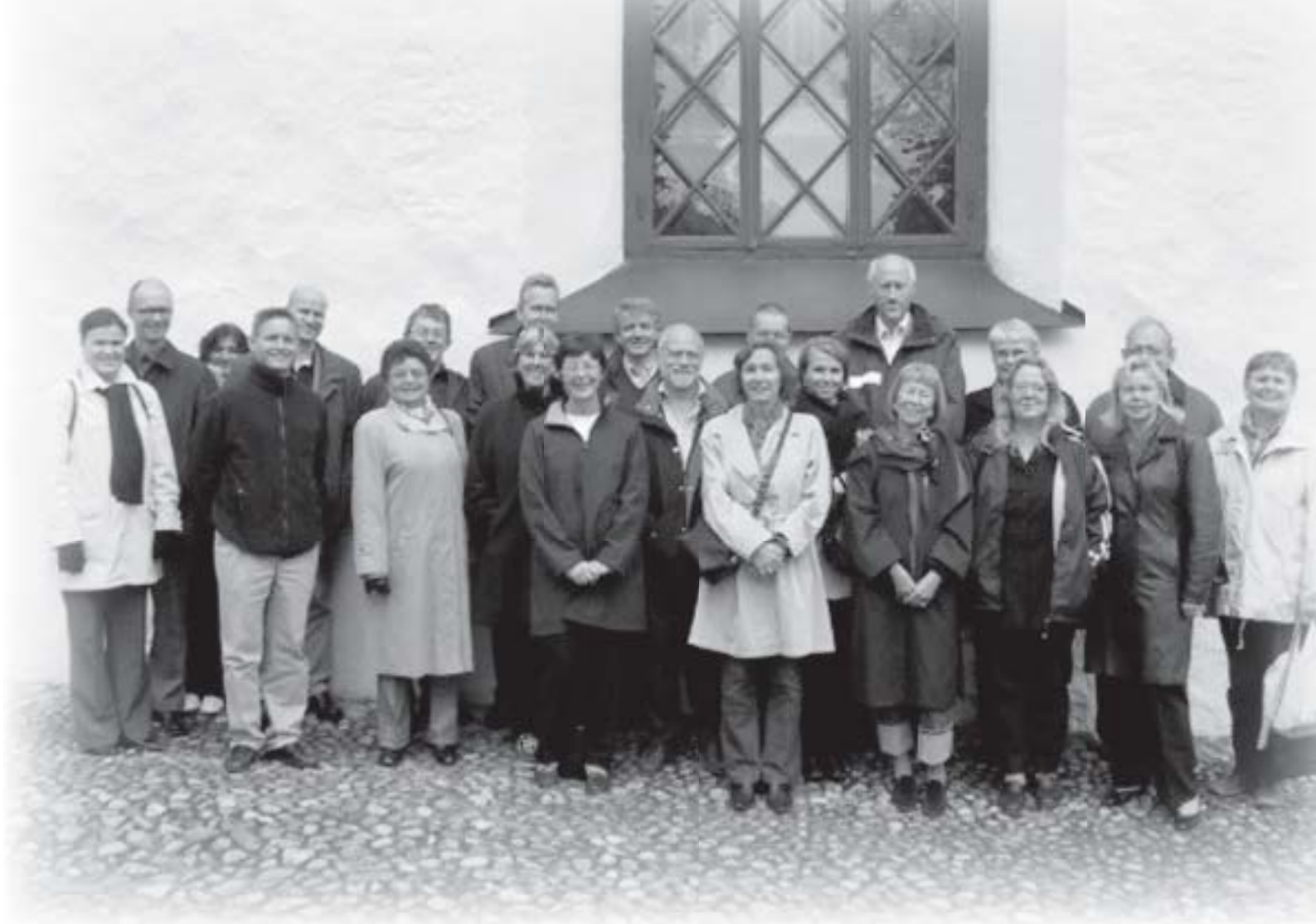
VTML osallistuu myös Pohjoismaiden valtiotyönantajien yhteistyöhön. Esimerkiksi syksyllä 2004 VTML ja Valtiokonttori järjestivät valtion eläkeasiantuntijoiden pohjoismaisen konferenssin Haikon kartanossa, Porvoossa. Kuva Helena Berg

elimenä yhteispohjoismaisten laitosten ja niiden henkilökunnan oikeudellista asemaa koskevissa kysymyksissä.