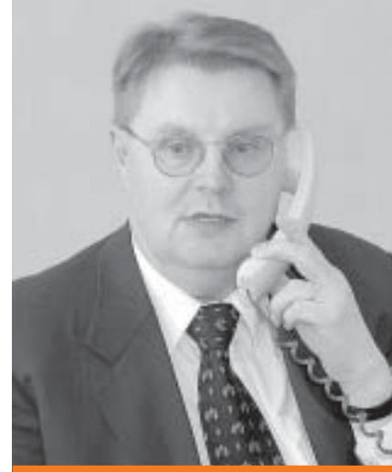
Teuvo Metsäpelto Valtion työmarkkinajohtaja

Aitoa palkansaajajärjestöjen sopimusoikeutta täytyy myös valtionhallinnossa vastata työnantajan mahdollisuus ottaa vastaan työtaistelu ja joskus myös itse käyttää lain mukaisia työtaistelukeinoja, jos ratkaisua ei saada sopimalla. Ei voi olla niin, että valtionhallinnossa on vapaa sopimisoikeus sellaisella alalla, jossa valtio ei voi ottaa vastaan työtaistelua. Valtion keskustason sopimusosapuolten tulee paneutua keinoihin työrauhan turvaamiseen valtionhallinnossa.