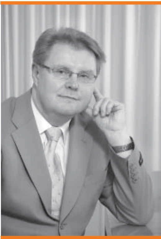
Teuvo Metsäpelto Statens arbetsmarknadsdirektör